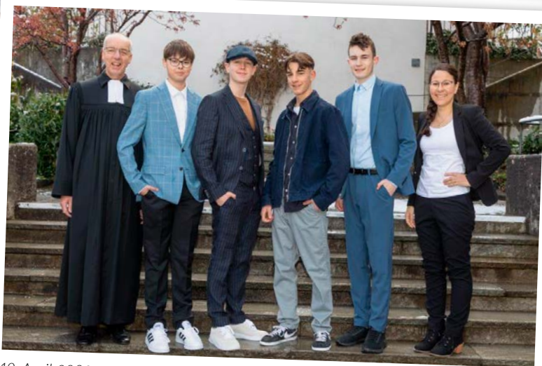
10. April 2022 «Be a man!»