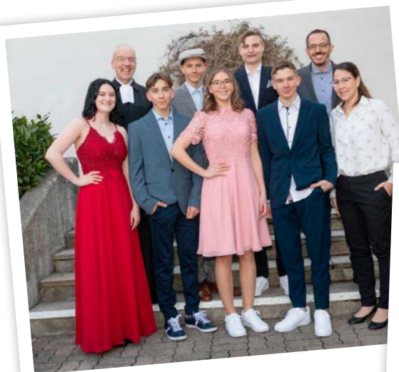
3. April 2022 «Die Hoffnung stirbt zuletzt!»