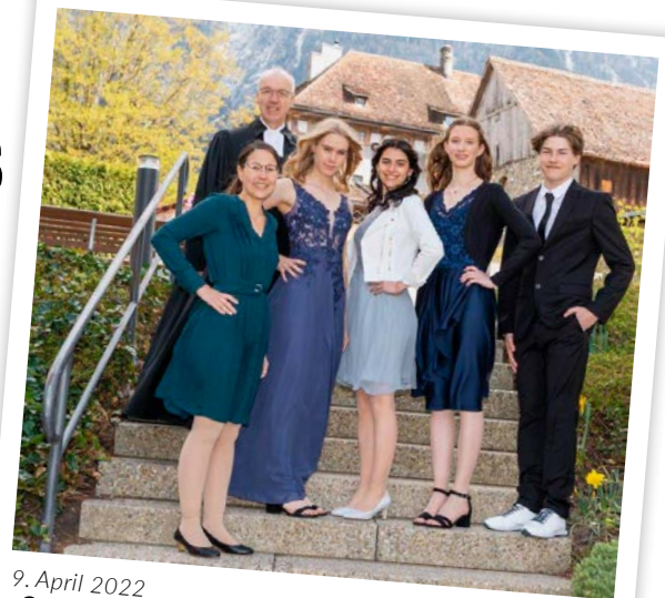
9. April 2022 «Go tell it on the mountain!»